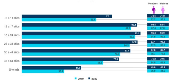
Gráfica 5 USUARIOS DE INTERNET, SEGÚN GRUPOS DE EDAD Y SEXO 2019 y 2022 (Porcentaje)

1 Incluye a las personas que no especificaron su edad. Nota: Porcentajes calculados respecto al total de la población de referencia